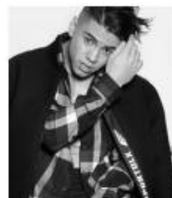
@BIEL - 6,1M