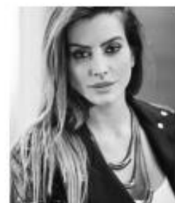
@CLEOOFICIAL - 7,6M