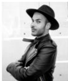
@HUGOGLASS - 11,2 M