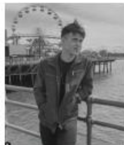
@GUSTAVOROCHA - 6M