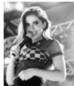
@ANITTA - 27,4 M