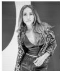
@SABRINASATO - 12,3M