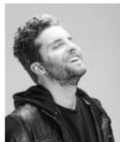
@THIAGOFRAGOOSO - 1,5M