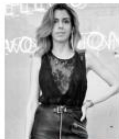
@CAMILACOUTINHO - 2,3M