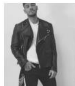
@LUCASLUCCO - 14,2M