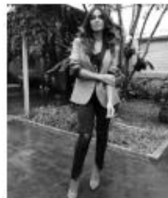
@DIDIDATO - 6,3M